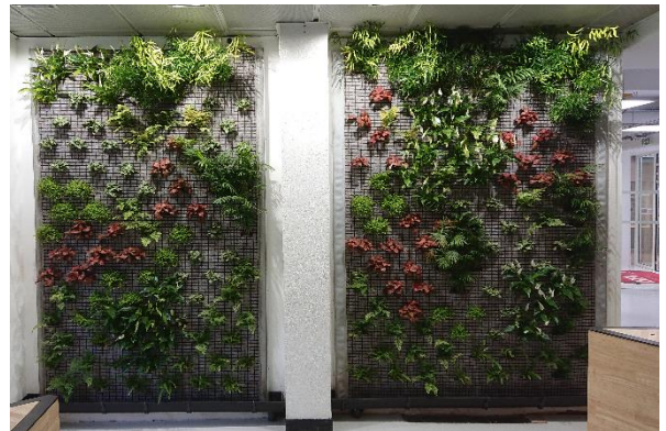
Un mois après plantation