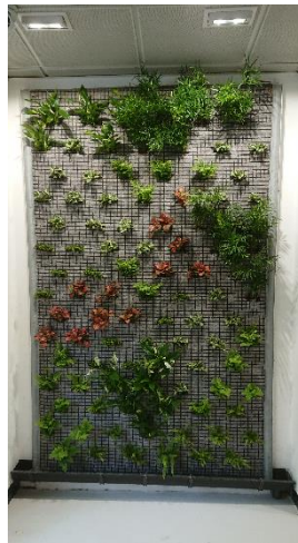
jour de plantation